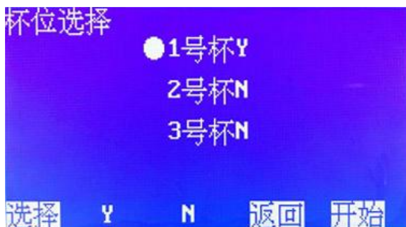
图 4. 杯位选择界面