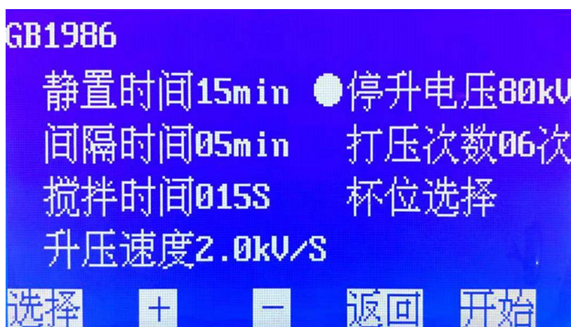
图 3. GB1986 子页面