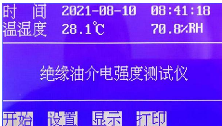
图 1. 开机页面