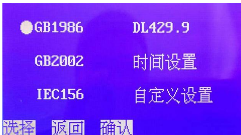
图 2. 选择子页面