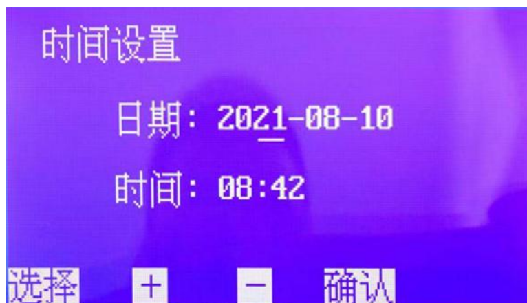
图 6. 时间设置子页面

按 选择 键移动光标—至年、月、日、时、分处，按 + 或 - 键选择具体数值后，按 确认 键确认，并返回开机页面；