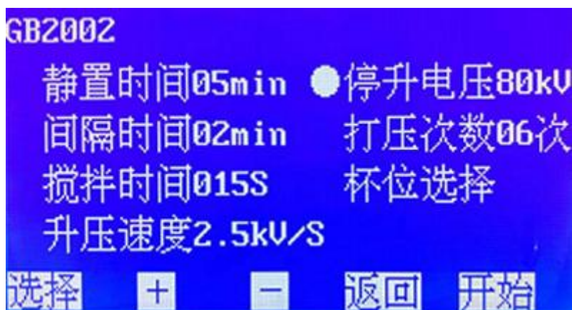
图 5. GB2002 子页面

在图 5 页面下，按 + 或 - 键设置 停升电压 ，其默认值是 80\text{ kV} ，可选范围 10\text{ kV}\sim 80\text{ kV} （档位增量 10\text{ kV} ）。选择好停升电压后，按 选择 键移动光标至 杯位选择图 5 ，选择好杯位后，按 开始 键进行测试。