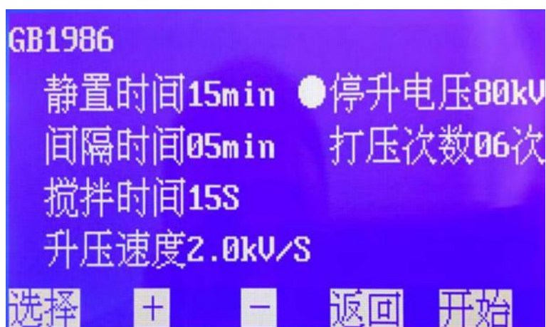
图 3. GB1986 子页面

在图 3 页面下，按 + 或 - 键设置 停升电压 ，其默认值是 80\text{ kV} ，可选范围 10\text{ kV}\sim 80\text{ kV} （档位增量 10\text{ kV} ）。选择好后按 确认 键返回开机页面，按 开始 键进行测试。