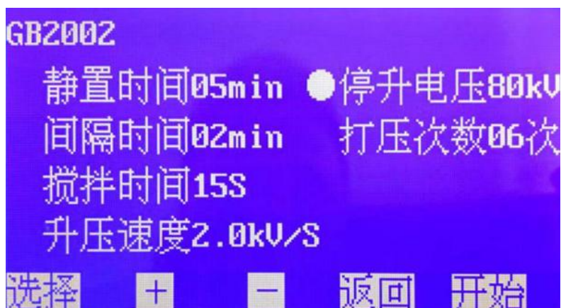
图 4. GB2002 子页面

在图 4 页面下，按 + 或 - 键设置 停升电压 ，其默认值是 80\text{ kV} ，可选范围 10\text{ kV}\sim 80\text{ kV} （档位增量 10\text{ kV} ）。选择好后按 确认 键返回开机页面，按 开始 键进行测试。