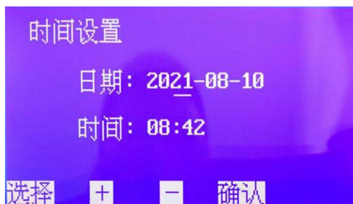
图 5. 时间设置子页面

按 选择 键移动光标 — 至年、月、日、时、分处，按 + 或 - 键选择具体数值后，按 确认 键确认，并返回开机页面；