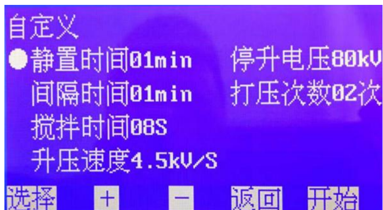
图 6. 自定义设置子页面

在图 6 页面下，按 选择 键移动光标到相应的选项，再按 + 或 - 键可进行相关参数的设置。其中：